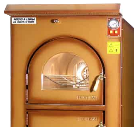
CON CAPPA VAPORE